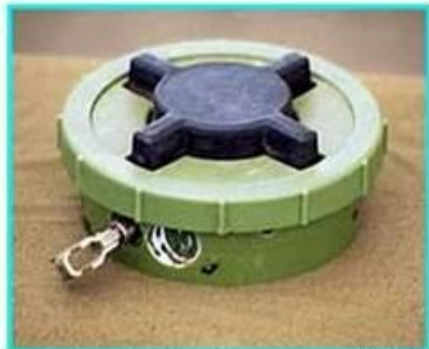
Рис.1 Общий вид мины ПМН-2