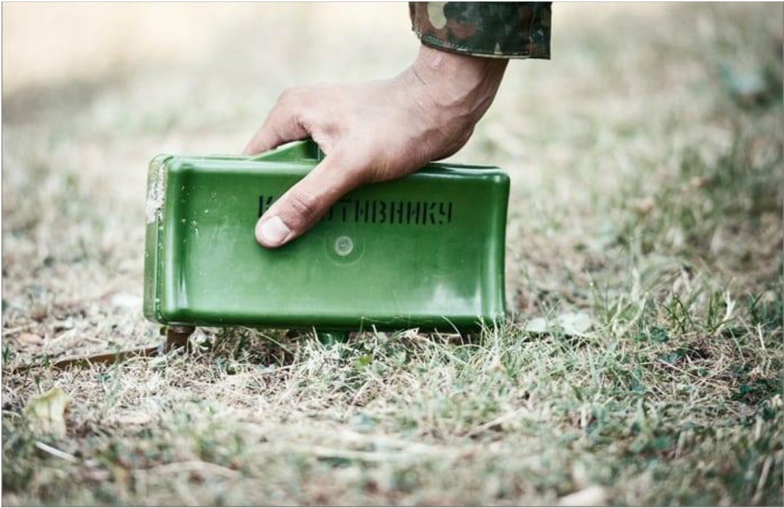
Мина в боевом положении